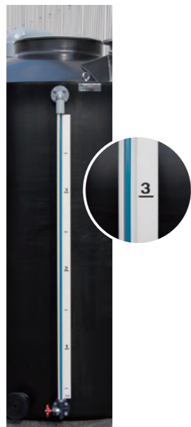
AV 式 標準的な連通式液面計。容量の可視範囲は下記の表をご参照ください。

! 目盛板は精密な容量表示ではありません。 PE タンクの場合、寸法公差や膨れなどが生じるため目安として見てください。