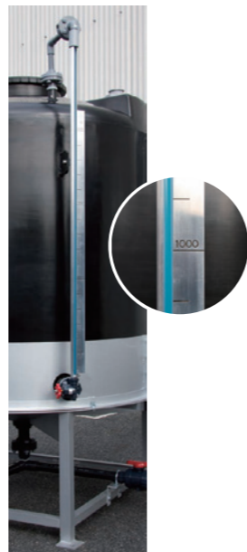
天板返し式 タンク最大容量値まで確認ができる連通式です。